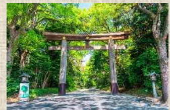
明治神宮の杜を舞台に、 特別な夏の思い出づくりを！