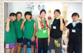
1日目の夜は全力レクリエーション！