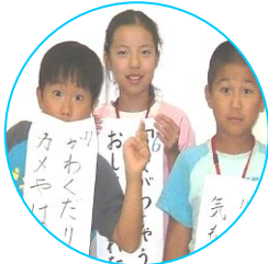
●和歌で自分を表現!