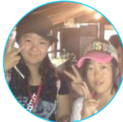
●友だちとの班活動!