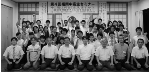
やる気みなぎる集合写真

中高生セミナーでは、感動の歴史との出会い、志を語り合う友との出会いの中で、自分自身と出会い、自らの生き方を磨いていきます。