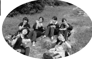
無限の力を引き出す 野外研修の 楽しいひととき