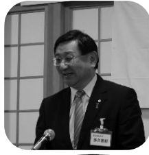
活力が湧いてくる講義